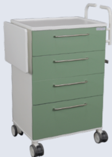
Toimenpidevaunu, jossa pienillä reunoilla varustettu pöytälevy. Sivulla työntökahva ja lisätyötaso.