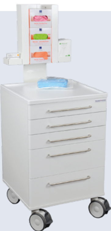
Yleishoitovaunu koossa 84x55x55cm, antamaan lisää säilytystilaa täyttämättä kuitenkaan koko huonetta.