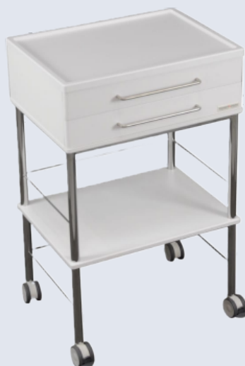
Helposti liikuteltava hoitajavaunu. Saatavilla joko laatikoilla tai ilman. Pinnat helposti puhdistettavat ja saatavilla paljon lisävarusteita.